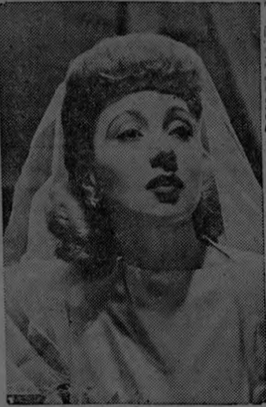
Max Factor Jr., experto en belleza femenina, declara que el cabello de la linda estrella de M.G.M ANN SOTHERN es uno de los más lindos de Hollywood

Muchas mujeres que hacen trabajos físicos en los que tienen que esforzarse, no se lavan el cabello con bastante frecuencia. Si el sudor y la suciedad peligran la belleza de su cabello, lávelo más a menudo de lo que lo haría si no trabajase. Si no lo hace, puede dañar su belleza de modo permanente y hasta poner en peligro la salud del cuerpo cabelludo. A pesar de la opinión que tienen muchas, el lavado del cabello nunca es demasiado, como no puede decirse