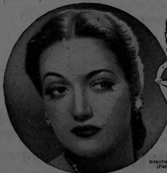
DOROTHY LAMOUR (Paramount)