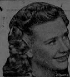
Priscilla Lane de la Warner Bros.

50 varas al Oeste de la Botica Francesa - Apartado 1995